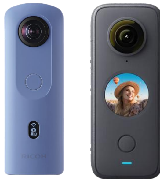
360度カメラ THETA（シータ）・Insta360